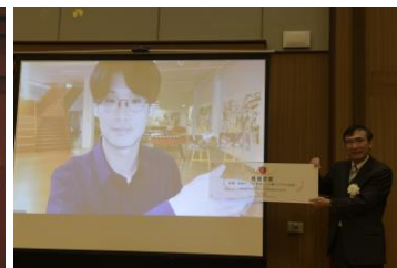
M-BIP (Matching HUB-Business Idea Plan Competition) 2021 表彰式の様子